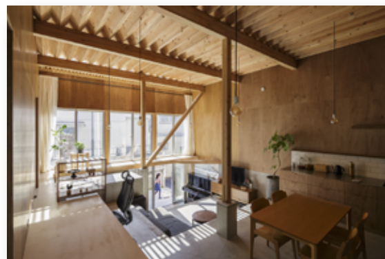
地続きの床と浮床

時 間 16:30～18:30 (受付16:00～) 会 場 中央工学校 STEPホール〈創立85周年記念館〉 参 加 料 一般3,000円 学生1,000円