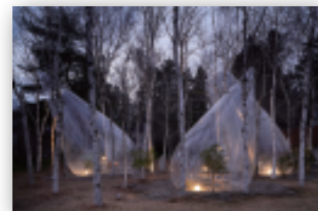
森の体験を切り取るテントDROP