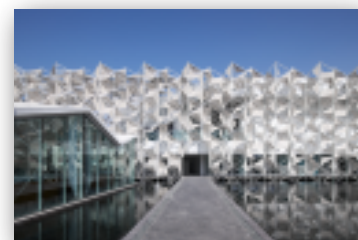
2020年ドバイ国際博覧会 日本館 Photo:2020年ドバイ国際博覧会日本館