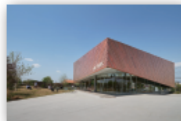
JINS PARK前橋