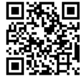
申込用 QR コード